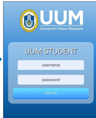
Sign in menggunakan username dan password yang sama seperti portal pelajar