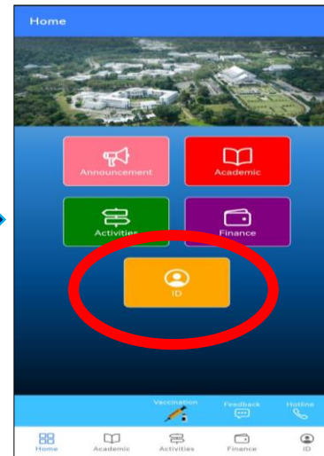
Klik pada ID